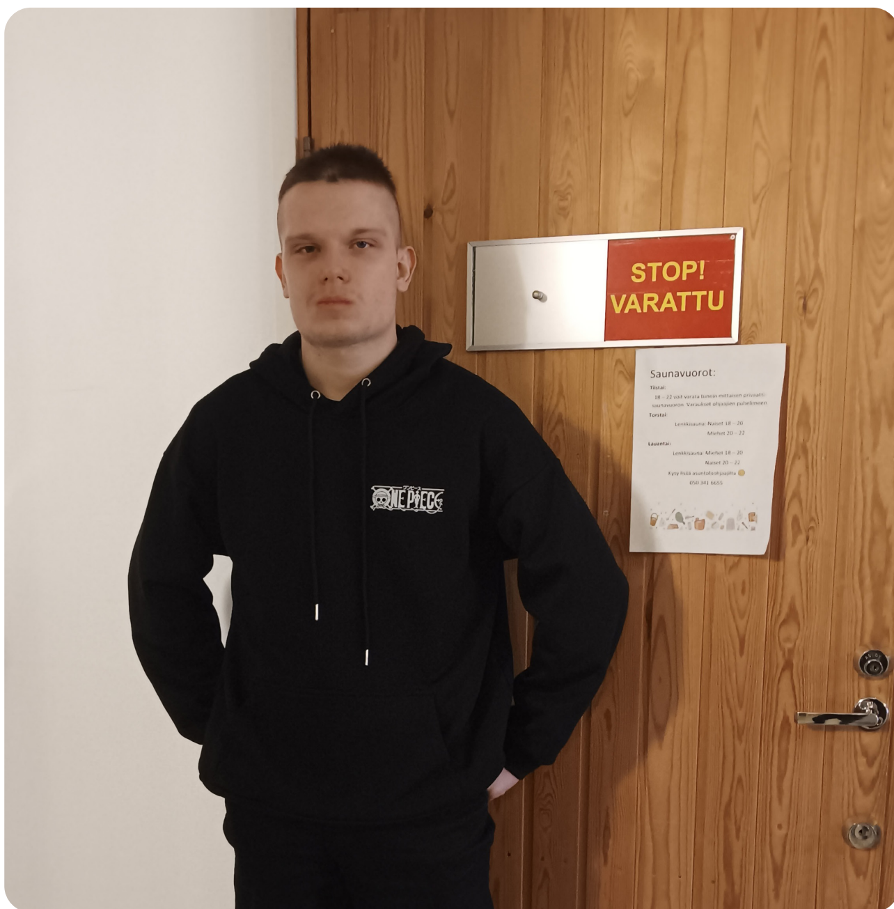
Patric: Kuva: Mikael