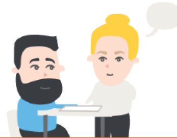
Oppimis- ja työskentelyvalmiudet