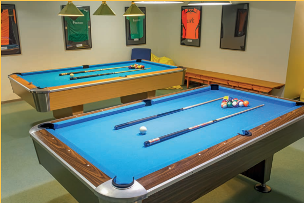
Liven asuntolan vapaa-ajan tila.

Asuntola on kahdessa tavallisen näköisessä kerrostalossa, jotka on rakennettu 90-luvulla. Sisältä löytyy vapaa-ajan tiloja sekä A- että B-rakennuksesta.