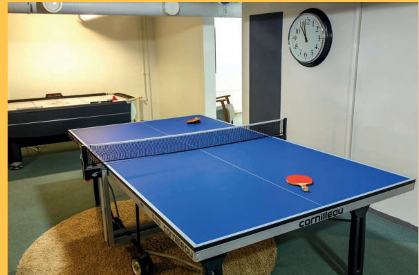
Toinen kuva asuntolan vapaa-ajan tilasta.

Asuntolassa on ohjattuja kerhoja kuten kahvila, kokkikerho, taidekerho ja pelikerho. Näihin kannattaa rohkeasti tulla vierailemaan kun tylsyytys iskee.