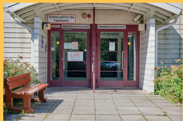
Ammattiopisto Liven asuntola.